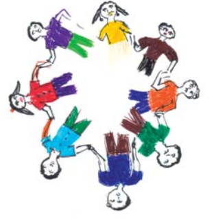
एच्.आय्.व्ही./एड्स माध्यम पुस्तिका भारत २००७

उत्तरदायित्व - निर्णयप्रक्रिया संचालित करणारे मग ते सरकारी, खाजगी किंवा नागरी संस्थांमधील असोत, ते अंतिमतः संबंधित लाभार्थींना उत्तरदाई आहेत.