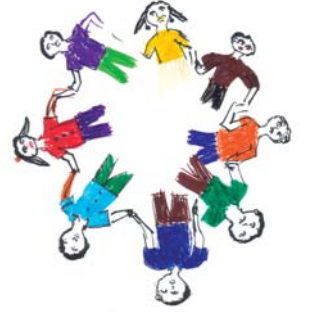
எச்.ஐ.வி / எய்ட்ஸ் ஊடகக் கையேடு இந்தியா 2007

நிறைவேறுவதை உறுதி செய்து கொள்ளும் முயற்சியே இது. சமூக அரசியல் செயற்பாங்கை ஆராய உதவும் கருவியாகவும் இது போன்ற எச்.ஐ.வி/எய்ட்ஸ் நிர்வாக விதிகள் உதவுகின்றன.